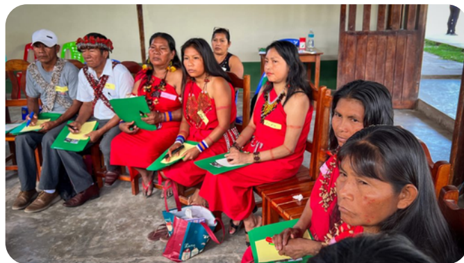
"Difusión y sensibilización sobre los casos emblemáticos de Morona y Chiriaco"