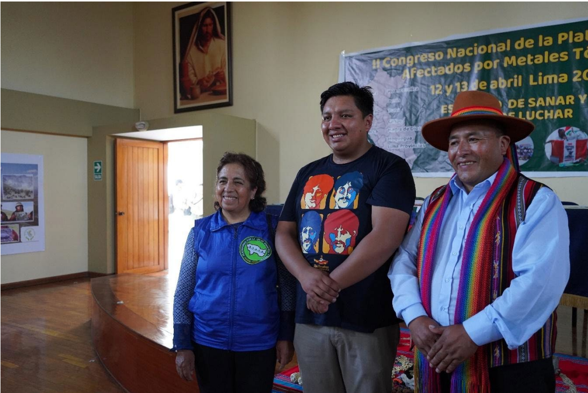
Los tres secretarios generales de la Plataforma Nacional de 2017-2024.